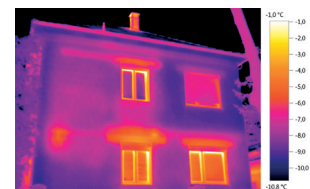
Imagine termică cu ScaleAssist